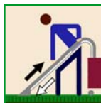
Carpet Shampoo Champú De la Alfombra