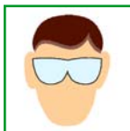
Safety Glasses Gafas de seguridad