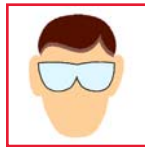
Safety Glasses Gafas de seguridad