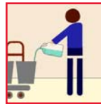
Cleaning Chemical Producto químico De la Limpieza