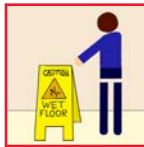
Wet Floor Signs Precaución - Piso Mojado