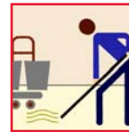
Mop & Bucket Mop y Cubo