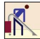
Wet/Dry Vac VAC mojado y seco