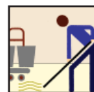
Mop & Bucket Mop y Cubo