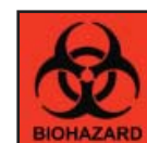
BioHazard Bag BioHazard Bolsa