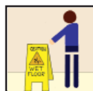
Wet Floor Signs Precaución - Piso Mojado