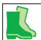
Protective Footwear Calzado Protector