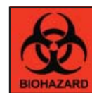
BioHazard Bag BioHazard Bolsa