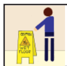
Wet Floor Signs Precaución - Piso Mojado