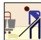
Mop & Bucket Mop y Cubo