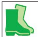
Protective Footwear Calzado Protector