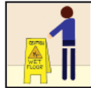
Wet Floor Signs Precaución - Piso Mojado