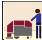
Auto Scrubber Depurador Auto