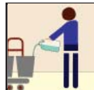
Floor Finish Producto químico De la Limpieza