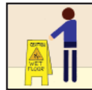
Wet Floor Signs Precaución - Piso Mojado