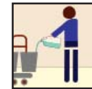
Cleaning Chemical Producto químico De la Limpieza