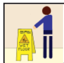
Wet Floor Signs Precaución - Piso Mojado