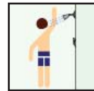
Shower Limpie La Ducha