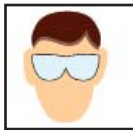
Safety Glasses Gafas de seguridad