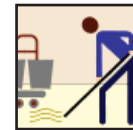
Mop & Bucket Mop y Cubo