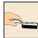
Scrub with Brush Friegue con el cepillo