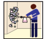
Foam Sprayer Rociador De la Espuma