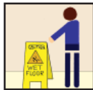
Wet Floor Signs Precaución - Piso Mojado