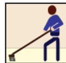
Floor Brush Cepillo para piso