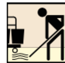
Mop & Bucket Mop y Cubo