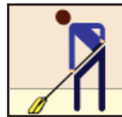
Floor Squeegee Escobilla de goma baja