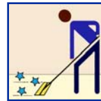
Finish Mop Mop Del Final