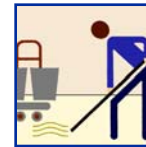
Mop & Bucket Mop y Cubo