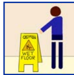
Wet Floor Signs Precaución - Piso Mojado