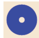
Burnishing Pad Pulimento Del Cojín