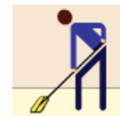
Finish Mop Mop Del Final