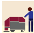
Auto Scrubber Depurador Auto