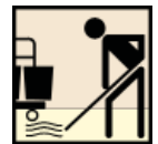
Mop & Bucket Mop y Cubo