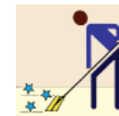
Finish Mop Mop Del Final