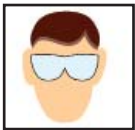
Safety Glasses Gafas de seguridad