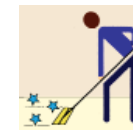
Finish Mop Mop Del Final