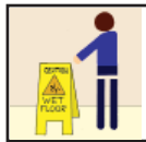
Wet Floor Signs Precaución - Piso Mojado