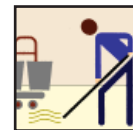
Mop & Bucket Mop y Cubo