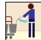
Cleaning Chemical Producto químico De la Limpieza