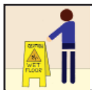
Wet Floor Signs Precaución - Piso Mojado