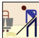
Mop & Bucket Mop y Cubo